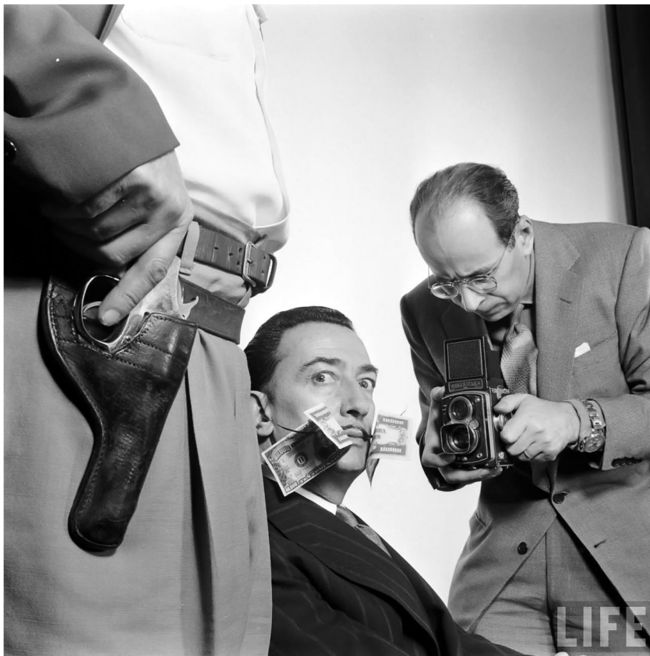
Philippe Halsman Looks At Dalí, 1954