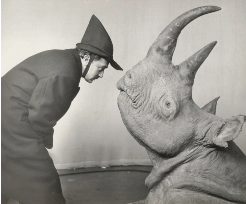
Dalí and the Rhinoceros. New York, 1956.

A Magnum ügynökség fotóriporterének egyik kedvenc témája volt Dalí bajsza, az éppen ma záró Philippe Halsmann Döbents meg! című, a svájci Musée de l'Elysée-ben megrendezett kiállítás sajtóanyagában is kifejtik, hogy a technikai nehézségek ellenére Halsman 1953-ban egy, a témába vágó könyvtel rukkolt el?. Az akkori technikai lehetőségeket maximálisan kihasználva dupla expozícióval, montázzsal, vágással és nagyítással készítette el Dalíról világhírű képeit. Mai bejegyzésünkben a Dalí ábrázoló, híres fotóművészek által készített portrékat mutatjuk be, mely közül nagy hangsúlyt fektettünk - egyik legjobb barátjának - Halsmann képeire.