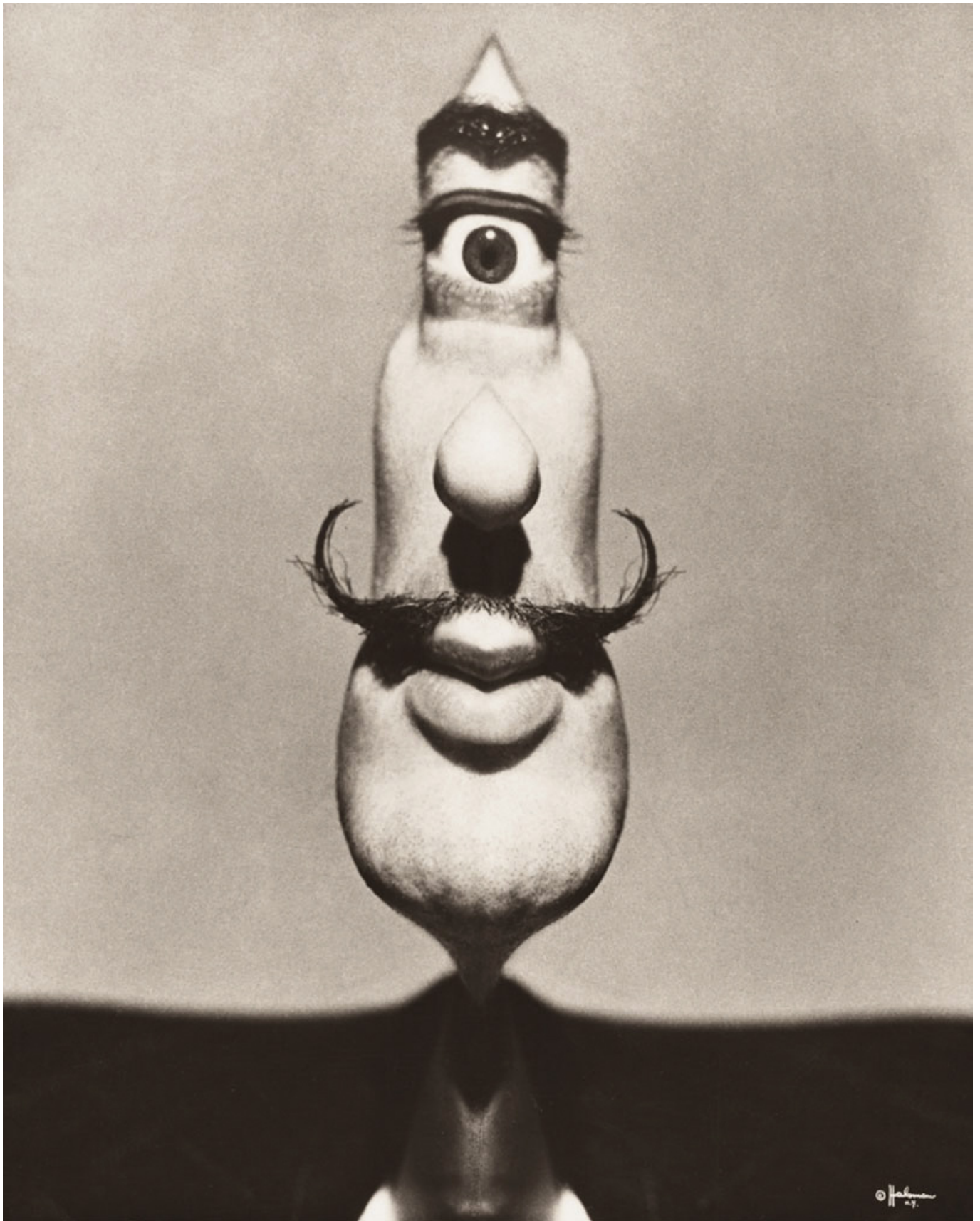
Fotó: Philippe Halsman: Dalí Cyclops, 1949 © 2013 Philippe Halsman Archive / Magnum Photos