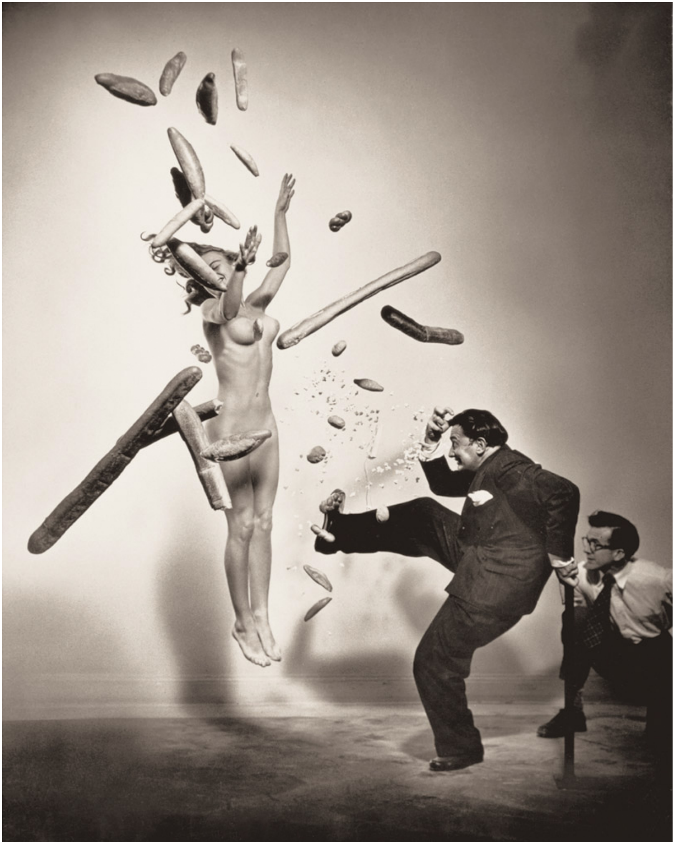
Fotó: Philippe Halsman : Salvador Dalí, 1951 © 2013 Philippe Halsman Archive / Magnum Photos