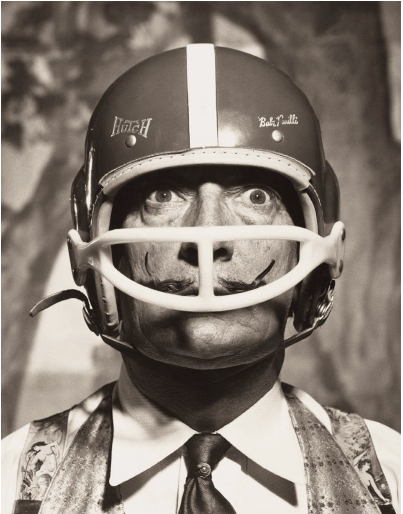
Fotó: Philippe Halsman: Portrait of Salvador Dalí with American football helmet, 1964 © 2013 Philippe Halsman Archive / Magnum Photos

(forrás: arttblart.com ; onlyoldphotography.tumblr.com ; pleasurephotoroom.wordpress.com ; magnumphotos.com ; life.com ; edali.org )