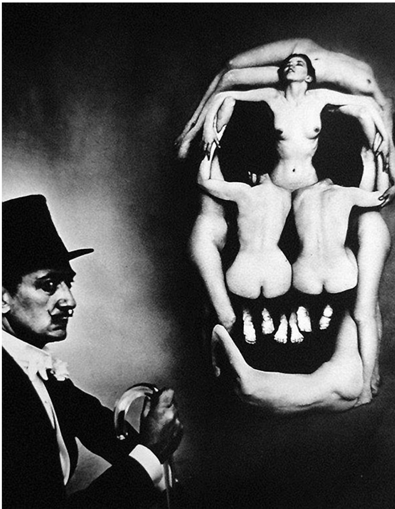
Fotó: Philippe Halsman: Salvador Dalí, 1951 © 2013 Philippe Halsman Archive / Magnum Photos