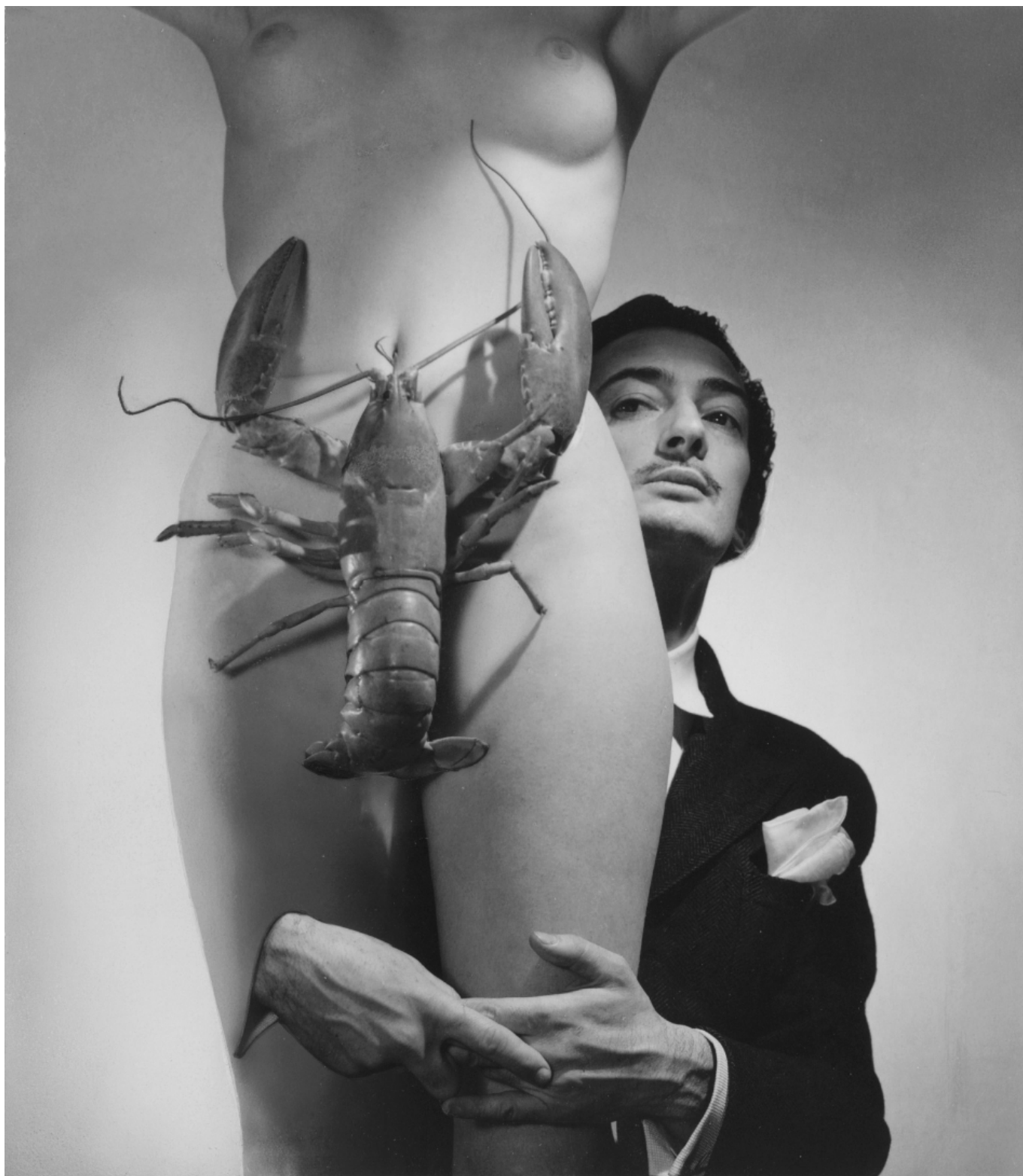
Fotó: George Platt Lynes: Salvador Dalí, 1939