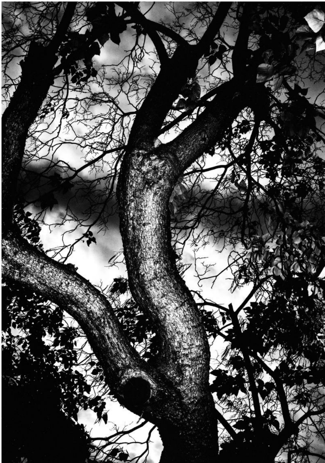
Fotó: David Lynch: Owl