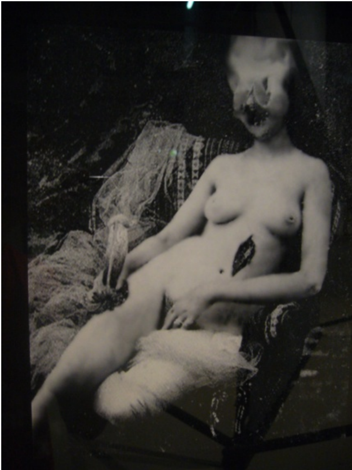
Fotó: David Lynch: Distorted Nudes

(forrás: theenglishgroup.co.uk ; thecatstreetgallery.com ; pleasurephotoroom.wordpress.com ; wallpaper.com )