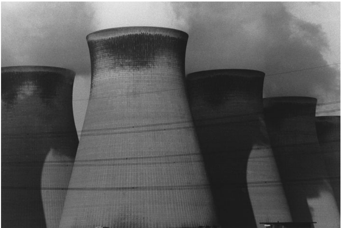
Fotó: David Lynch: 'Untitled (England)', late 1980s/early 1990s