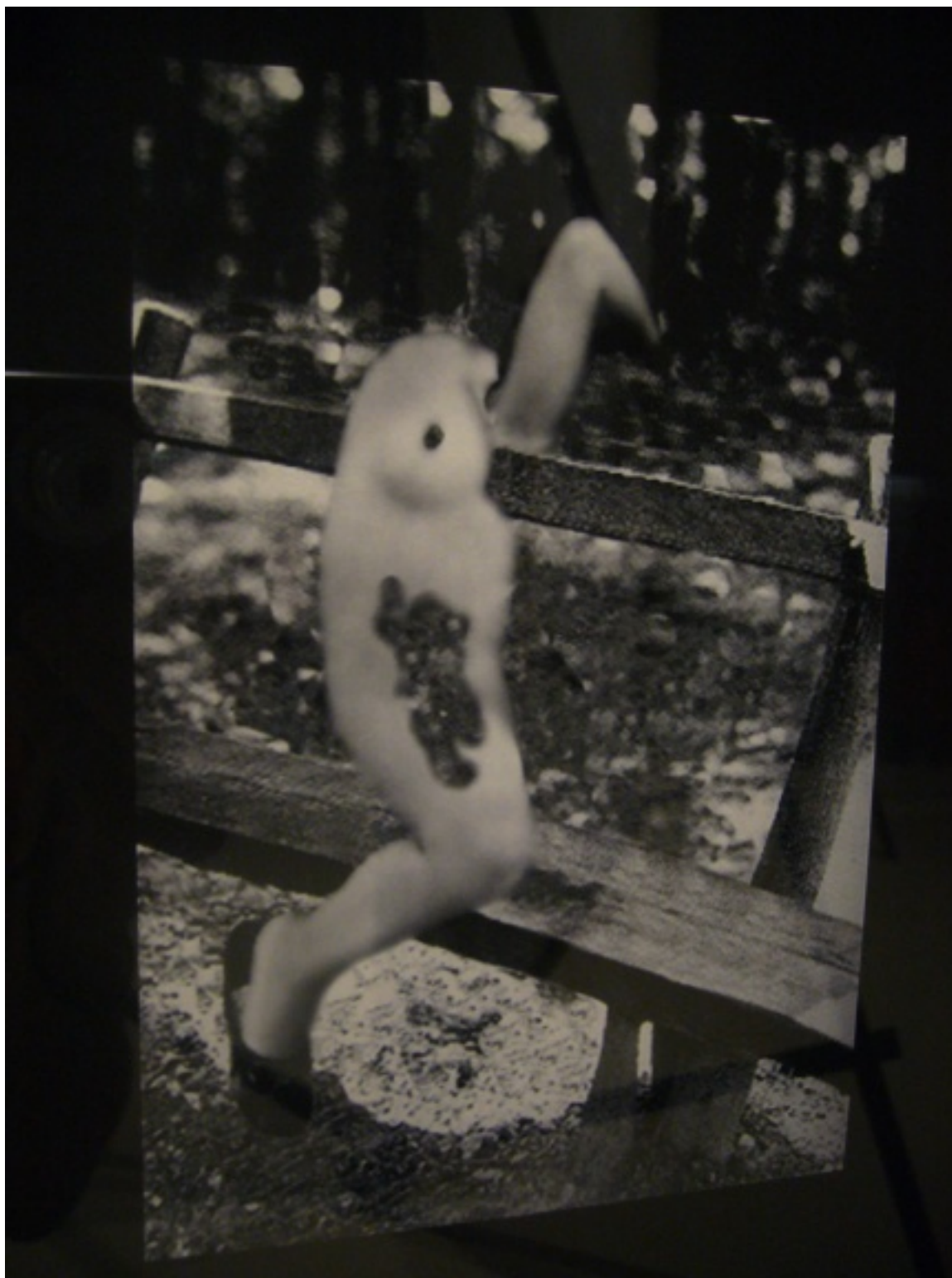
Fotó: David Lynch: Distorted Nudes