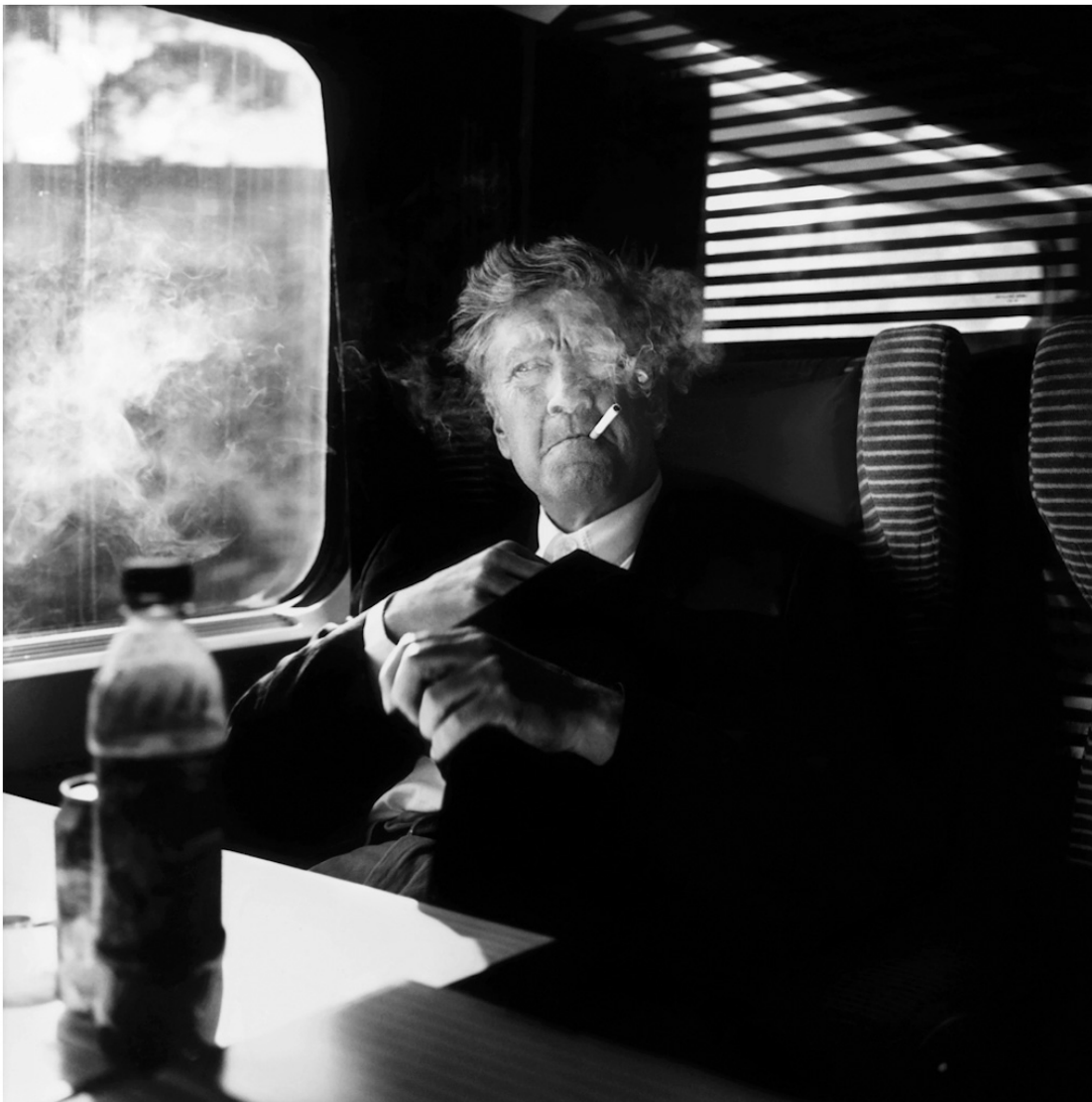
Fotó: Ludovic Carème: David Lynch, 2006

A munkásságát jellemző ellentmondások, a személyét övező kultusz egyértelműen bizonyítja, megkerülhetetlen alkotóról van szó. Lynch közel fél évszázados (!) pályafutása során összetéveszthetetlen szerzői világot épített és a mozi mellett számtalan művészeti ágban kipróbálta magát. Bármihez nyúl is, már-már monomániásan hasonló kérdésekre keresi választ és a szürrealista képzettársításai segítségével saját alternatív valóságába kalauzolja a közönséget. Akár filmről, tévésorozatról, festményről, bútorokról, zenéről vagy fotóról van szó, Lynch masszív hangulatú műveiben mindig a banális válik titokzatossá. Az ő szemén keresztül nézve a csinos felszín hirtelen rejtélyesnek tűnik, az ismerős, biztonságos világ mögött a mindent átható irracionális dereng fel. Az amerikai művész munkáiban a normalitás abszurd, relatív fogalomává válik, mely egyszerre felszabadító és feszültséggel teli érzéseket kelt a befogadóban. Lynch sajátos alkotói látásmódja segítségével képes a szerzőiségéhez igazítani és átformálni az adott médiumot.