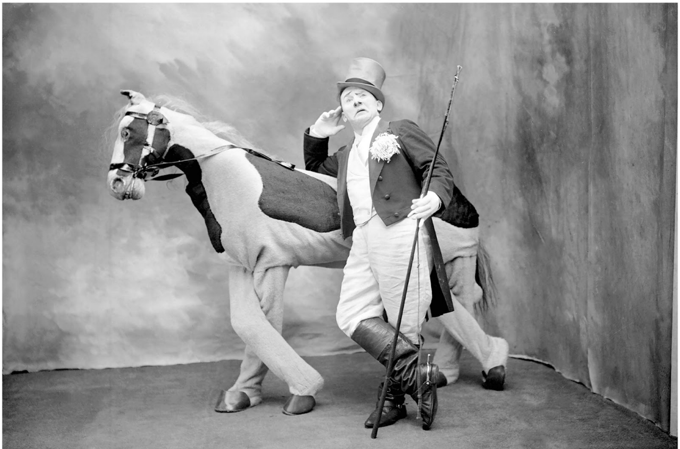
Fotó: Maurice-Louis Branger: Le clown Footit, Paris, 1903