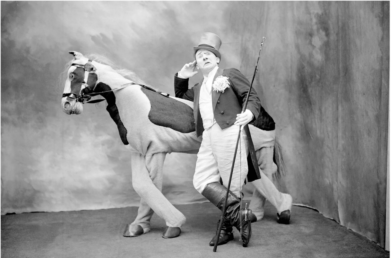
Fotó: Maurice-Louis Branger: Le clown Footit, Paris, 1903