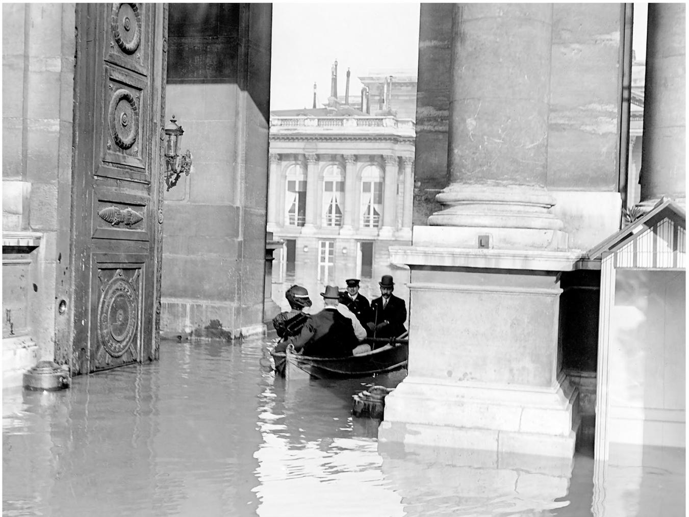
Fotó: Maurice-Louis Branger: La chambre des députés Paris floods in 1910 The House of Representatives

(forrás: reallifeiselsewhere.blogspot.hu )