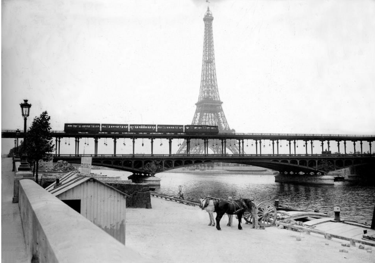
Fotó: Maurice-Louis Branger: Szajna, Párizs, 1908

Branger sokoldalú és aktív fotósként 1905 tavaszán Párizsban alapította meg a Photopresse ügynökséget, mely a franciaországi mindennapok megörökítését tűzte ki céljául. 1912-ben Branger a „legrégebbi és legfontosabb fotóügynökségnek” aposztrofálta munkahelyét. A kulturális, politikai vagy éppen sportesemények mellett képriportot készített az 1910-es párizsi árvízről , de 1913-ban az első Balkán-háborúban, majd később az első világháborúban is főtözött. Maurice-Louis Branger hetvenhat éves korában a franciaországi Mantes-la-Jolie-ban halt meg.