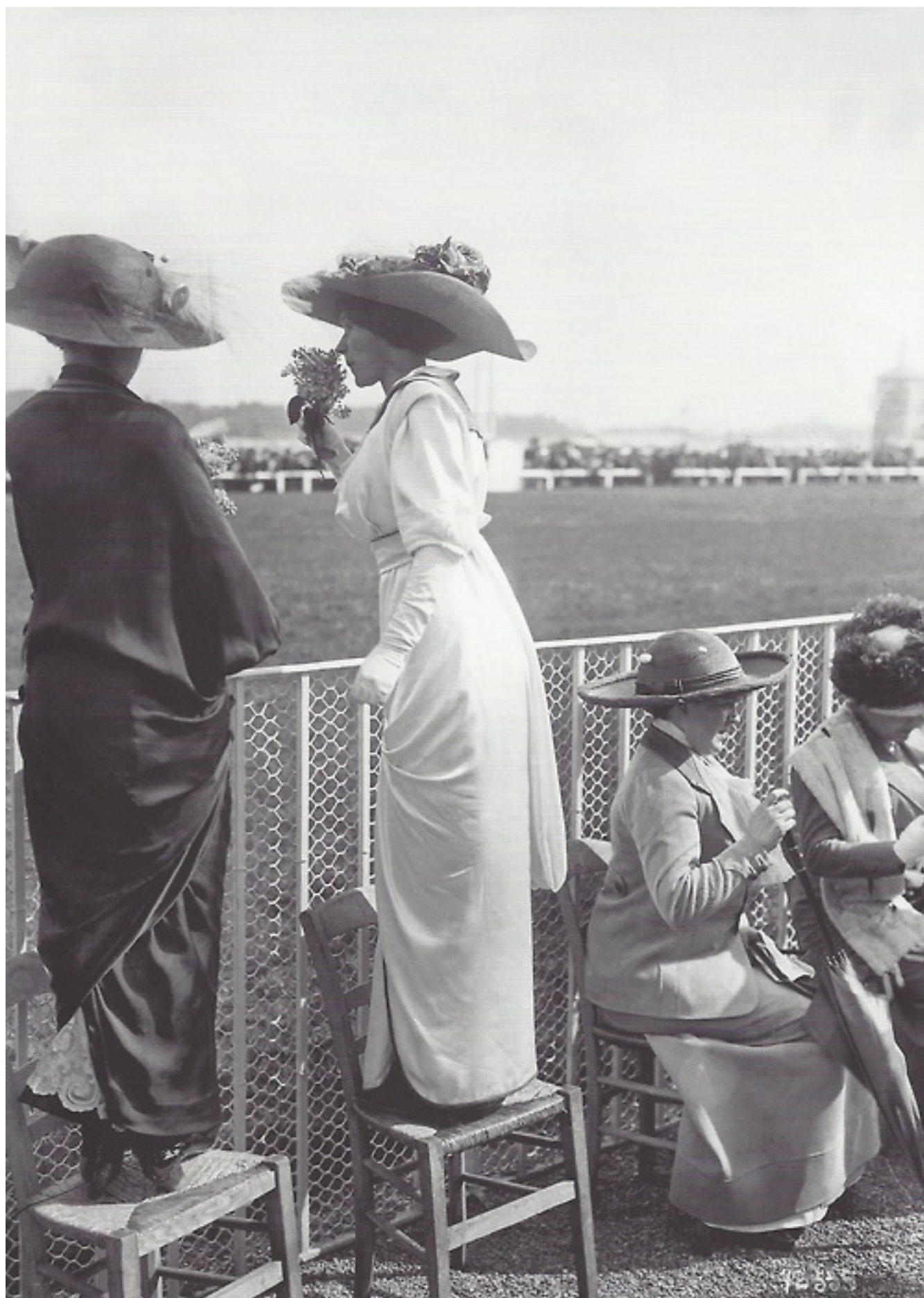
Fotó: Maurice-Louis Branger: Elégantes à longchamps, 1912