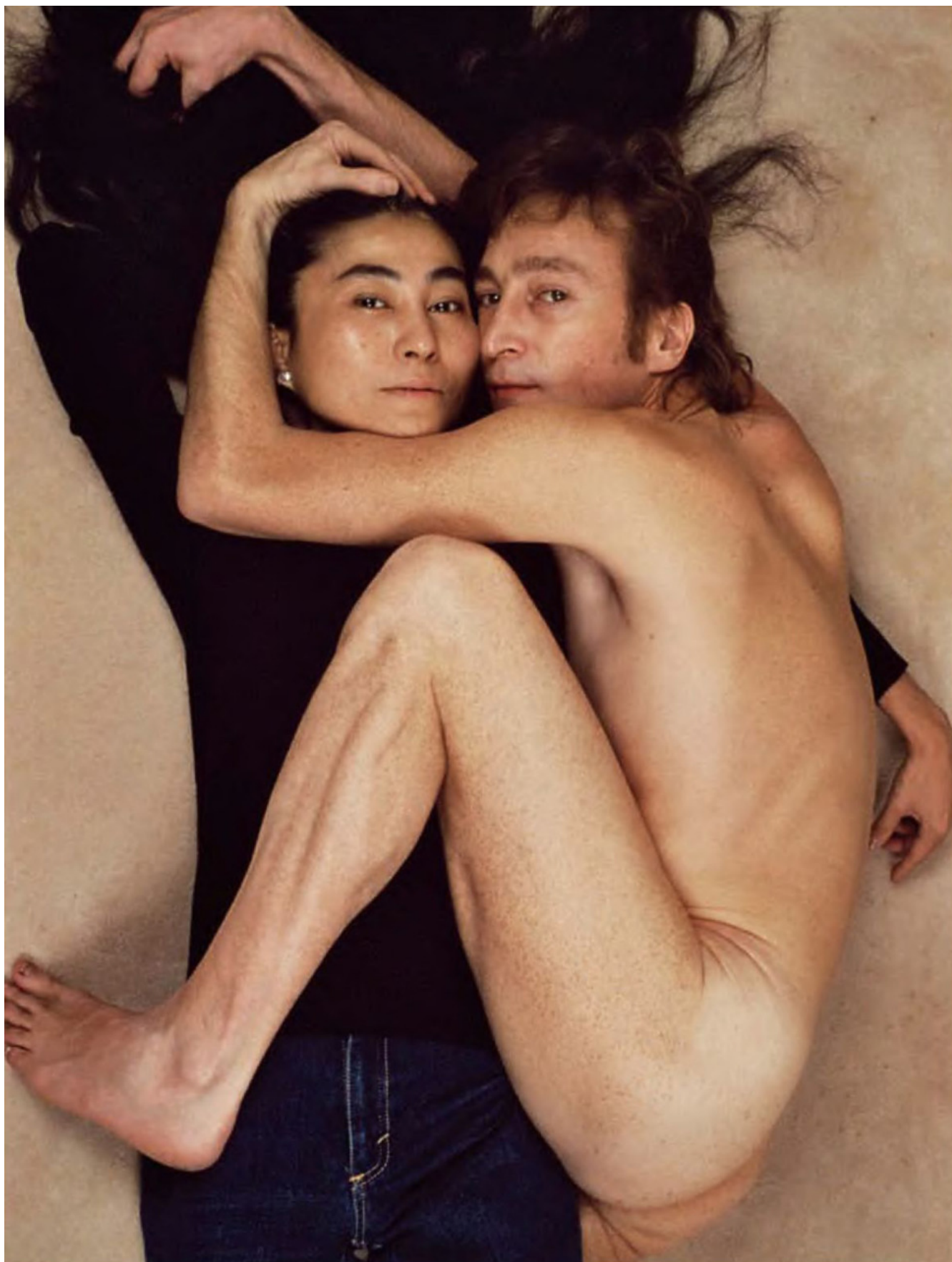
Yoko Ono and John Lennon, 1980 (egy ritkábban látott verzió)

Amikor az elkészült fotókat megmutatta a párnak, John Lennon kiválasztott egyet és rögtön rávágta: "Meg kell