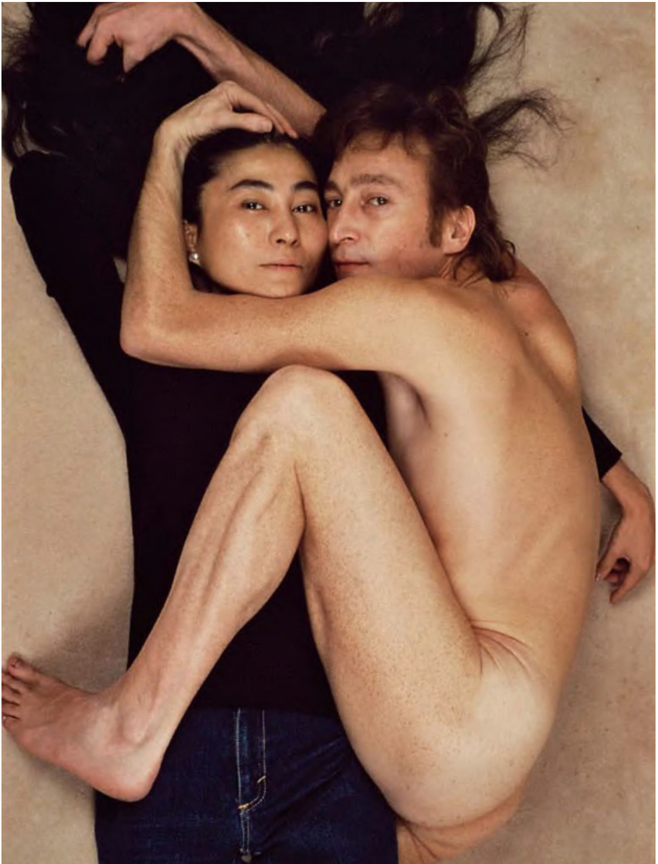
Yoko Ono and John Lennon, 1980 (egy ritkábban látott verzió)

Amikor az elkészült fotókat megmutatta a párnak, John Lennon kiválasztott egyet és rögtön rávágta: "Meg kell