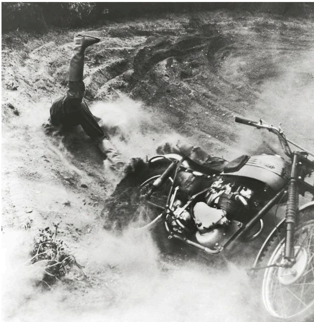
Loomis Dean: Sophia Loren a testvérével és az édesanyjával, 1957. december (forrás: life.com)