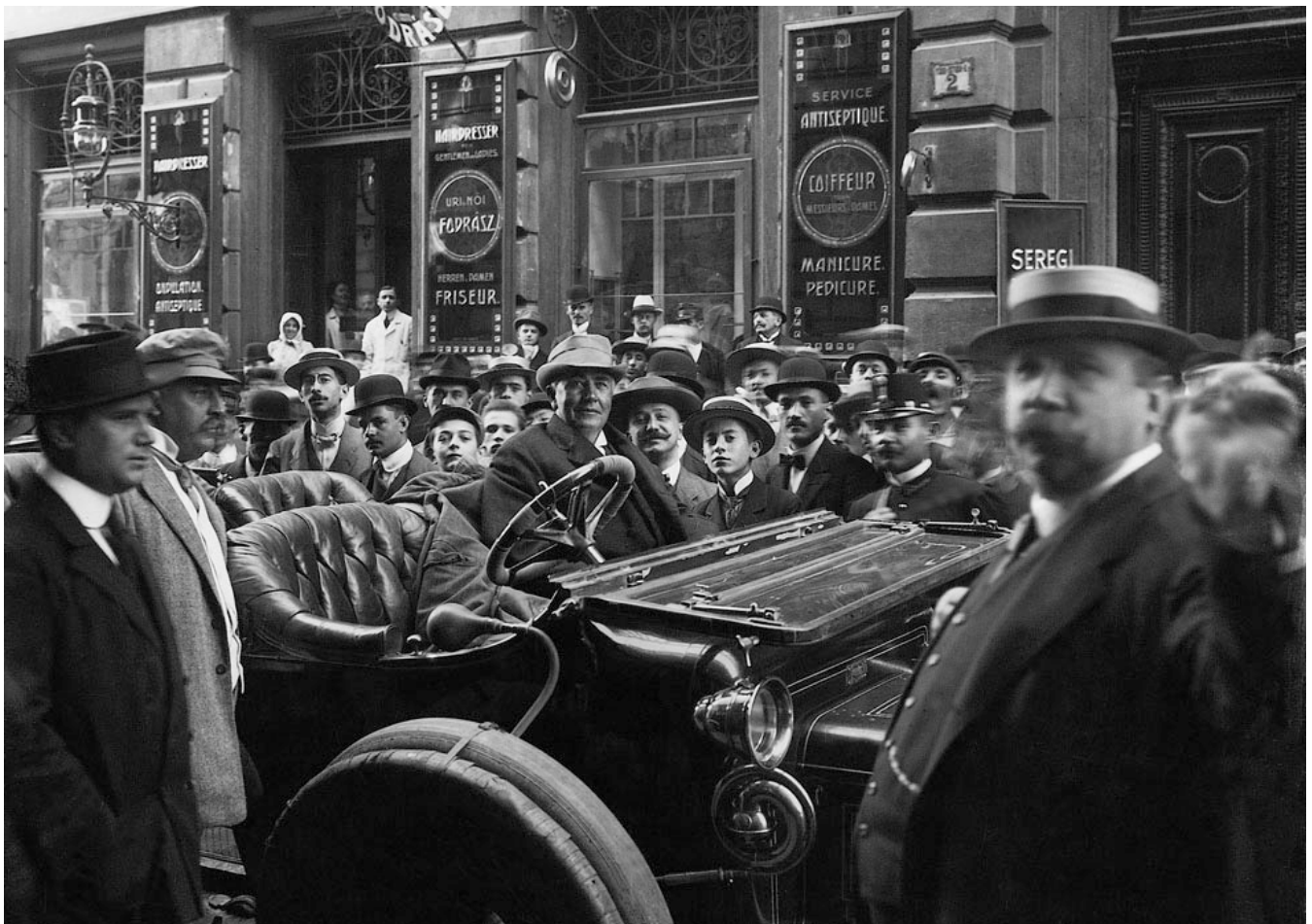
Fotó: Murray Becker: Hindenburg katasztrófa, 1937. május 6. (forrás: theatlantic.com )