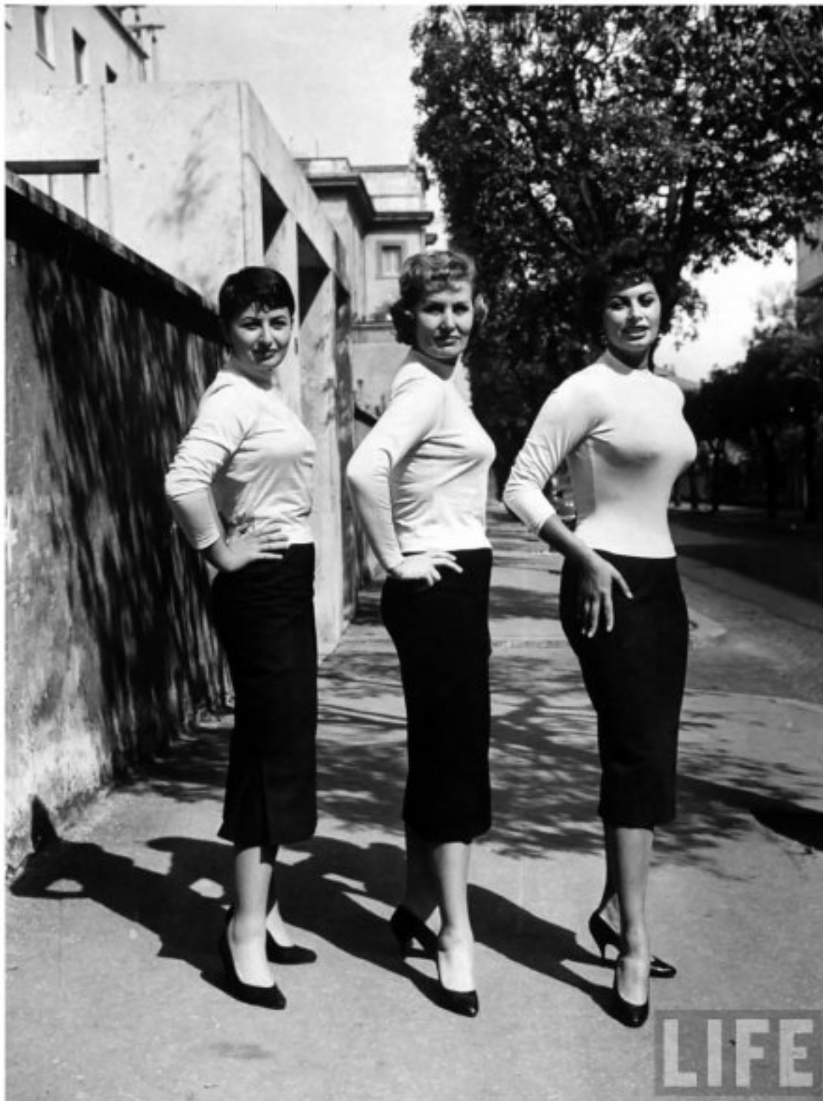
Fotó: William Anders: Earthrise, taken on December 24, 1968. Hasselblad fényképezőgéppel készült. (forrás: hasselblad.com )