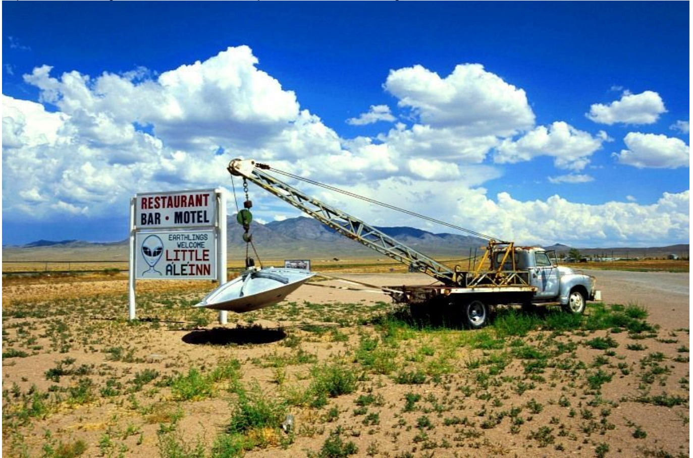
Az 51-es körzet létét 2013-ig hivatalosan tagadták

Az 51-es körzetről már azt megelőzően könyvtárnyi irodalom született, hogy az Egyesült Államok Központi Hírszerző Ügynöksége (Central Intelligence Agency, CIA) 2013. augusztus 17-én az előző évtizedek konzekvens tagadásával szakítva a nyilvánosság előtt hivatalosan beismerte, hogy az "Area 51" nemcsak a túlfűtött képzelőerővel megáldott ufó-hívők fantáziájában, hanem a valóságban is létezik.