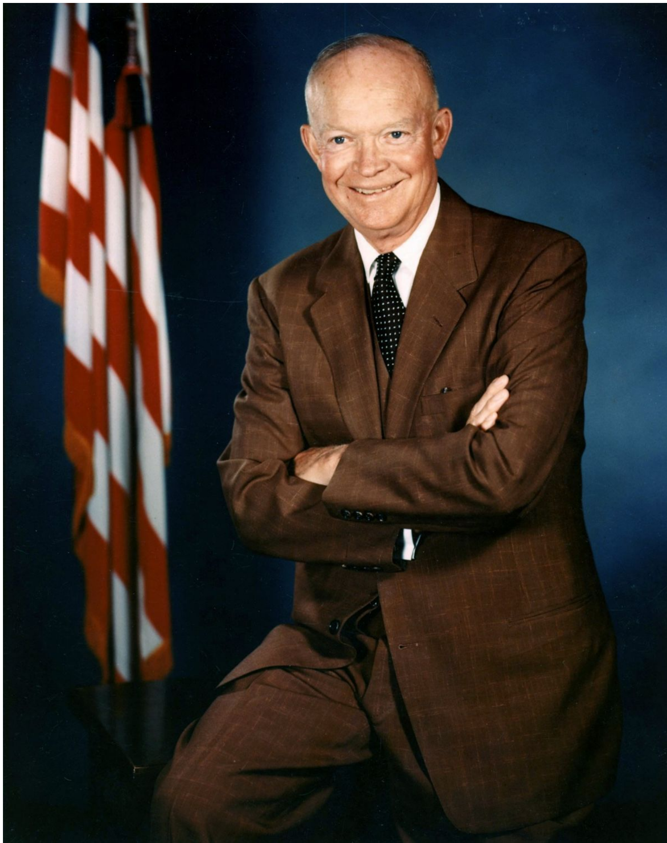
Eisenhower elnök 1955-ben írta alá a titkos utasítást az 51-es körzet felállításáról

A bázis köré egy több mint 100 kilométer széles, szigorúan őrzött és átléphetetlen zónahatárt húztak.