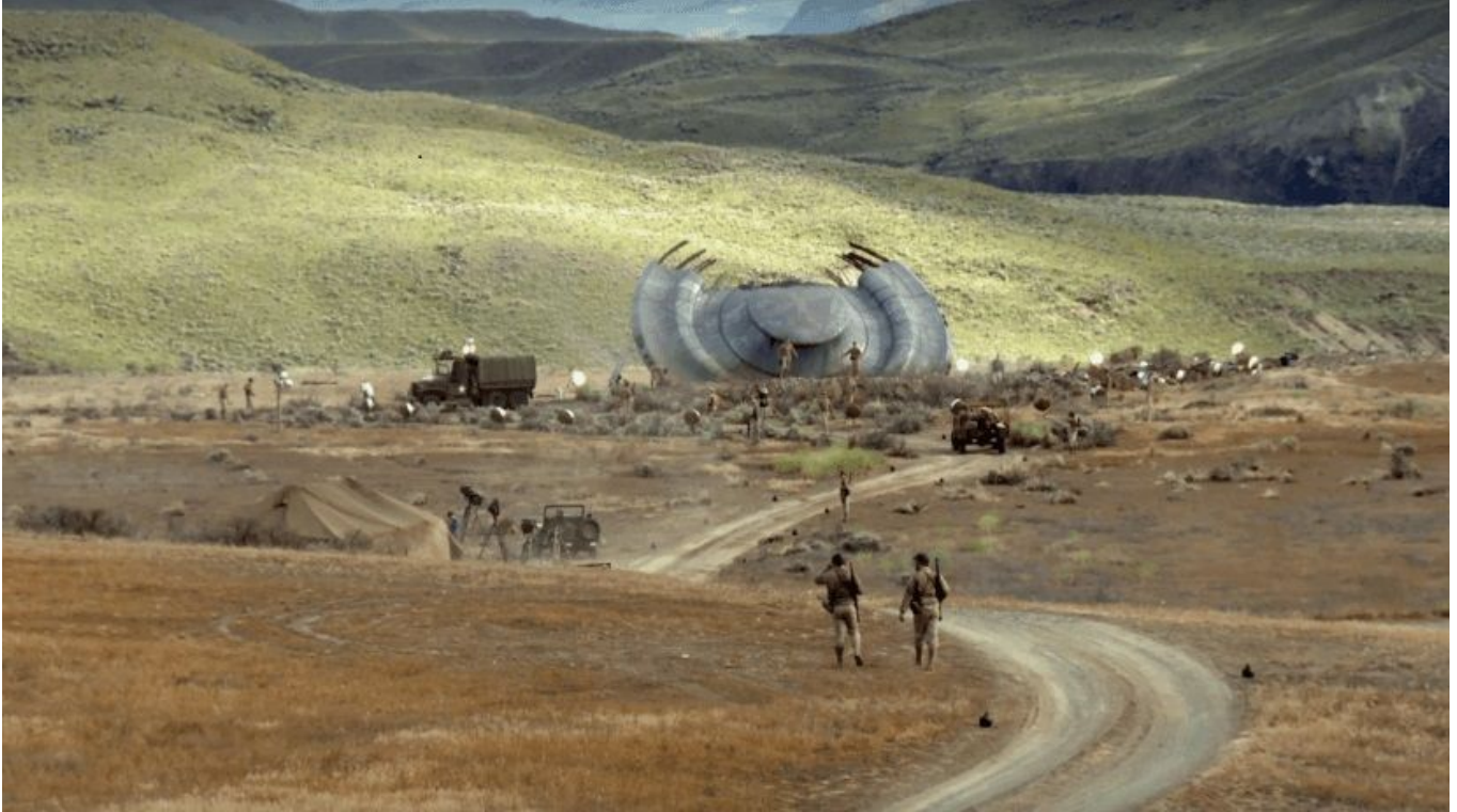
Lezuhant csészelajról suttogtak Roswell polgárai