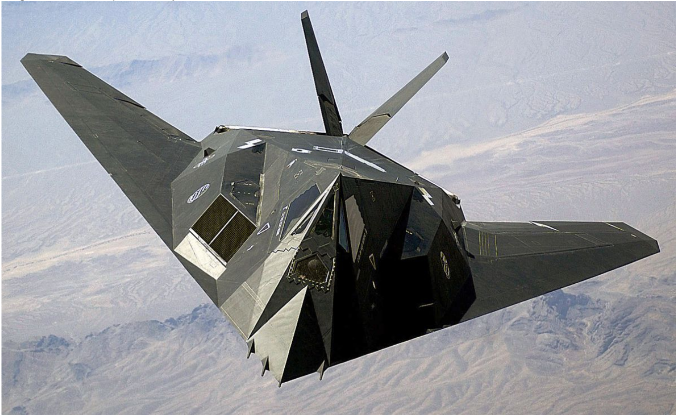
Az F-117 "Nighthawk" lopakodó

A nevadai sivatag mélyén rejtőz? 51-es bázisról kering? vad híreszteléseknek és összeesküvés-elméleteknek a CIA a 2013 augusztusában kiadott kommunikációjával akart egyszer és mindenkorra véget vetni. A hírszerző ügynökség bejelentése szerint az 51-es körzet a hidegháború idején kifejlesztett csúcstechnológiájú repülőgépek kísérleti teszttelepe volt, ahol többek között a Lockheed U-2 "Dragon Lady", illetve az SR-71 "Blackbird" magassági felderítő, valamint az első valódi lopakodó, az ugyancsak a Lockheed Martin által kifejlesztett F-117 "Nighthawk" tesztrepülései folytak.