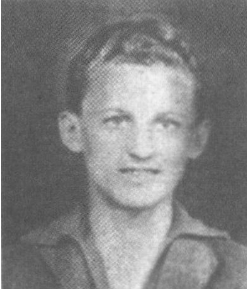
1955 körül készült fotó az "Isten éltesse Császár!" c. könyvről

A bírálói is a jót akarták még jobbra tenni, a klasszisból akartak zsenit faragni, amikor az „ácsorgásairól”, a csípőre tett kézről, meg a néha 20-30 perces holtidejeiről beszéltek, csak azzal a ténnyel nem nagyon tudtak mit kezdeni, hogy a „már megint végig álldogálta a meccset és csak reklamált” alapon tárgyalt rangadókat Albert Flórián kéthárom gólja döntötte el. Sokan süttették el vele kapcsolatban azt a butaságot, hogy „Nem tud ez a Flóri gyerek mást csak gólt lőni...”, meg azt is, hogy „Puskással egy napon sem lehet emlegetni...” ám ezek a hangok idővel elhalkultak, majd teljesen elhaltak, hiszen a gólokra lehet, ám idő múltán nevetséges fanyalgással reagálni.