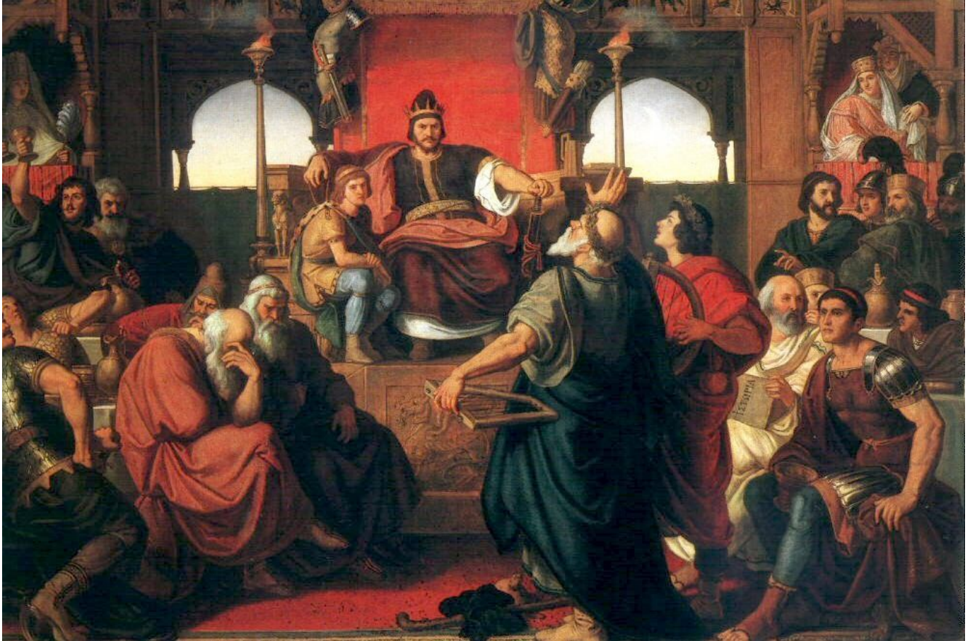
A hunok nagyfejedelme, Attila római követeket fogad egy XIX. századi romantikus festményen Fotó: Wikimedia Commons/Than Mór

A hunok a Krisztus utáni 370-es évek végén törtek be Kelet-Európába, ahol megalapították a történelem egyik legerősebb nomád birodalmát. Ez a kelet- és nyugatrómai impériumot egyaránt felforgató birodalom azonban alig néhány évtizeddel később szétesett. A történelmi közgondolkodásban a hunok Attila harcos népével azonosak, pedig az a helyes, ha nem csak egyetlen hun birodalomról beszélünk.