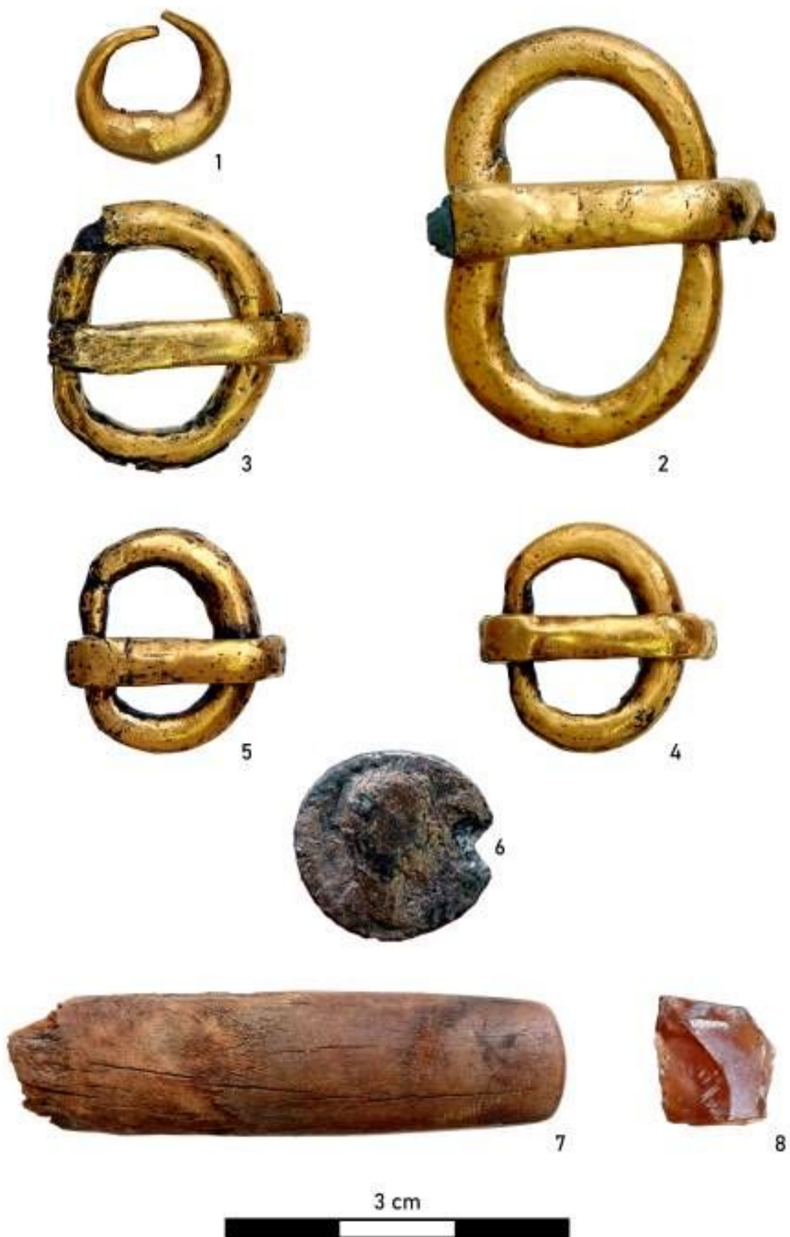
Sírmellékletek a kecskeméti, V. századi férfitemetkezésből!