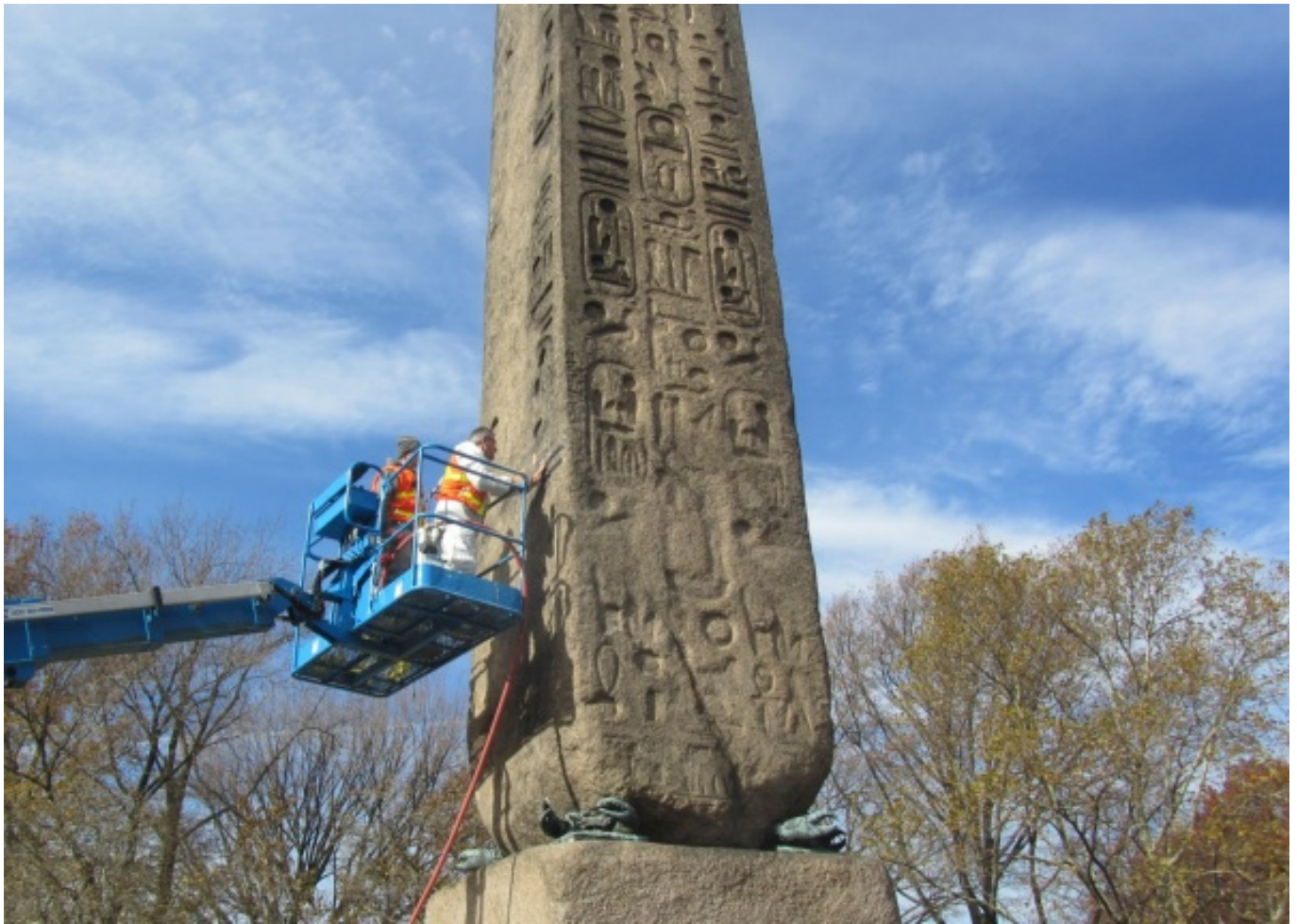
Állapotmegóvás az obeliszken

Érdekesség, hogy egy idő kapszulát is helyeztek az obeliszk alá, ami tartalmazza az 1870-es amerikai népszámlálási adatokat, a Bibliát, a Webster szótárát, Shakespeare összes művét, egy egyiptomi útikönyvet és az amerikai függetlenségi nyilatkozat egy másolatát.