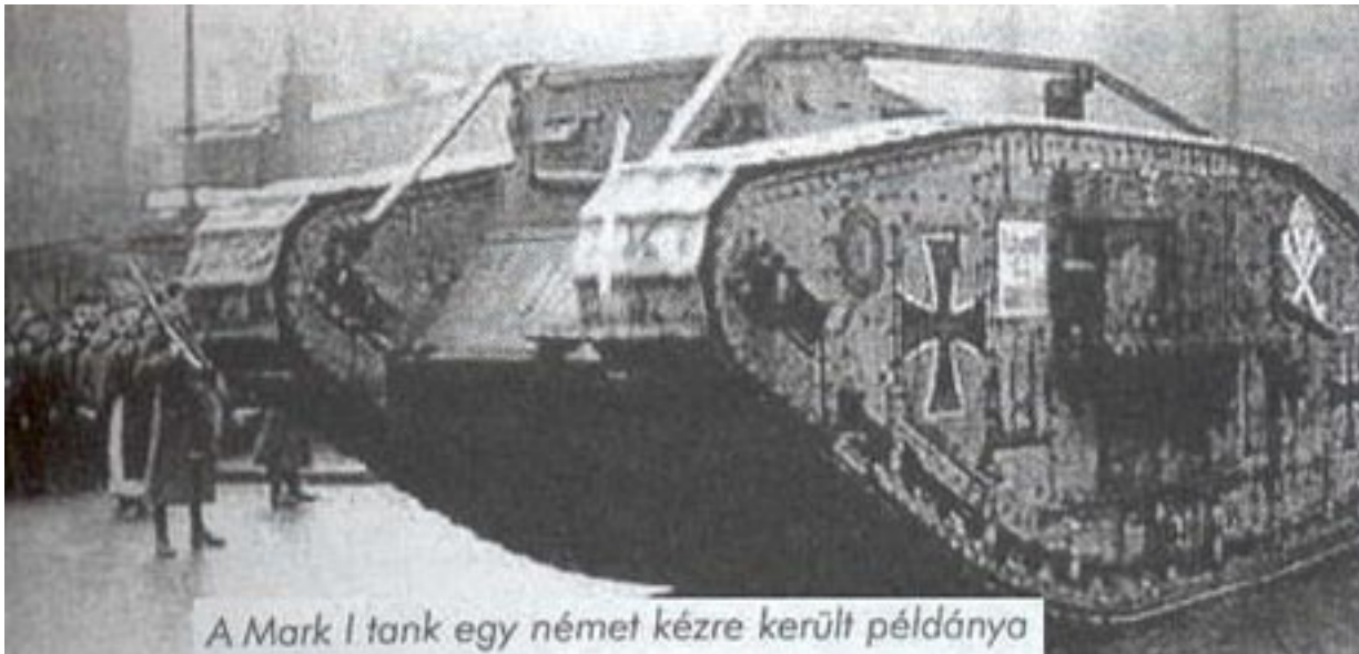
A Mark I tank egy német kézre került példánya

A harckocsik közül sokféleképp lehet választani. Lehet pragmatikusan. De a szabad embert nem határozza meg a praktikum. Tehát esztétikai alapon is lehet választani, sőt. És ideologikusan is. Nézzük az utóbbit előbb.