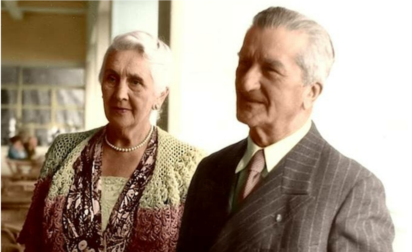
Horthy Miklós és neje

- Igen - mondja és arcára a felháborodás kifejezését er?lteti - de közben valóságos forradalom tört ki ebben az országban. Azok a kormányférfiak, akikkel a barátsági szerz?dést kötöttem, szám?zetésbe mentek, s?t egyeseket börtönbe is zártak.