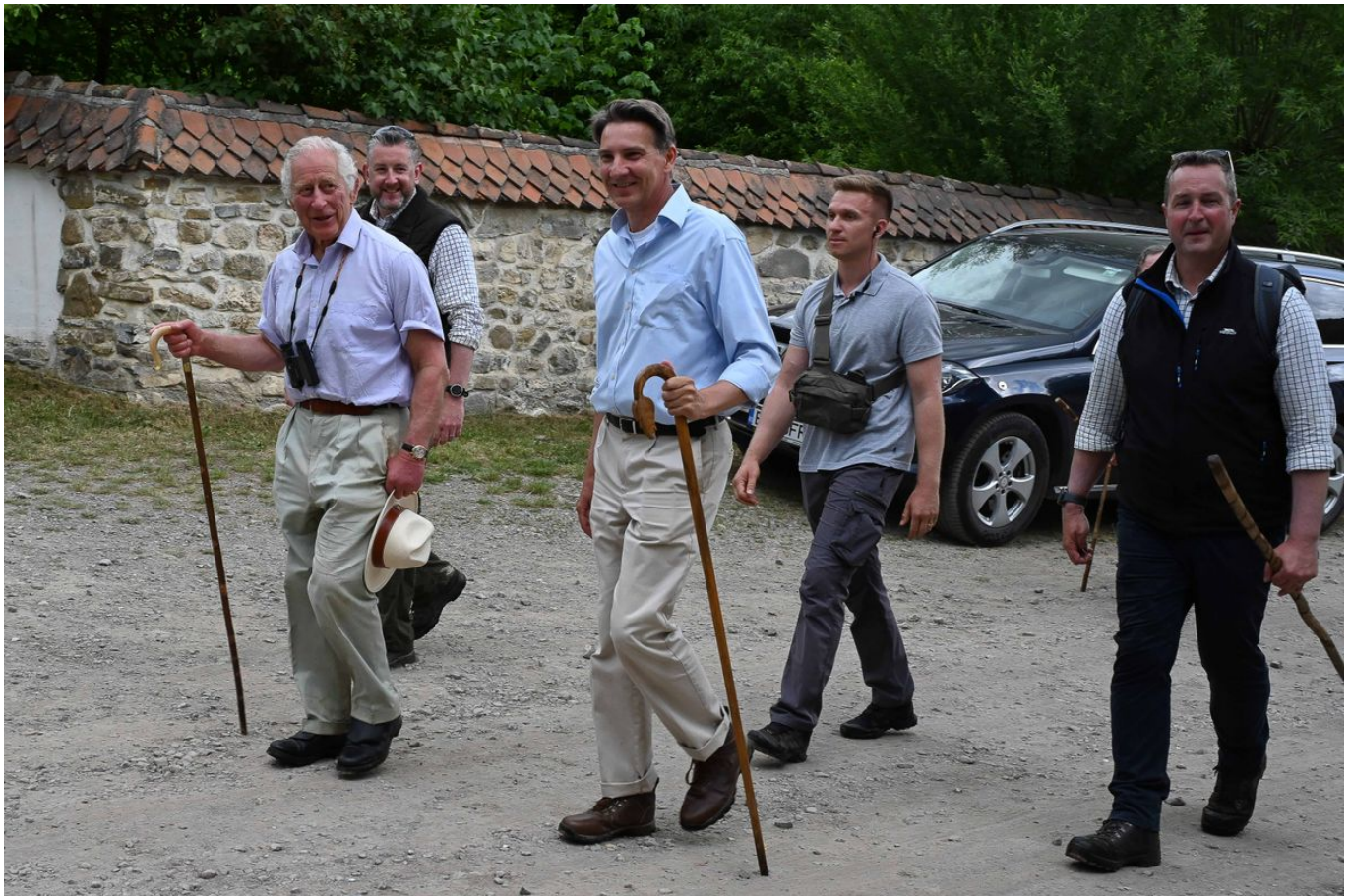
III. Károly brit király (balra) sétájáról tér vissza székelyföldi birtoka elött Zalánpatakon 2023. június 5-én. Mellette vendéglátója, Kálnoky Tibor (középen).