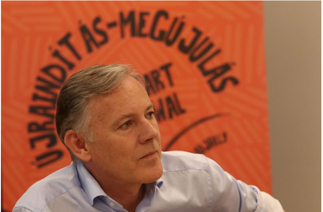
Boris Kálnoky.

De Boris Kálnoky mindenekel?tt az otthonkeresés és hazatalálás csaknem ötszáz oldalas szellemi kalandját írja meg, az identitás újjáépítését talán a szokványosnál is különlegesebb Kálnoky, az 1900-ban született Hugó nagypapa sorsán és sorsfordító villámcsapásain keresztül. Apákról és fiúkról beszélve el h?störténeteket, családi adományokat és kísértethistóriákat pletykálva, töprengve és vívódva, az ?sapák felemás dics?ségéb?l és cáfolhatatlan bukásaiból merítve példákat.