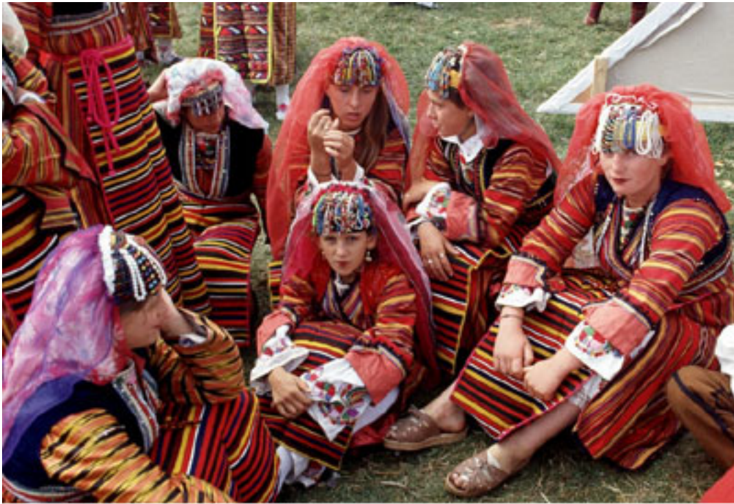
Pomak women, dressed in traditional costume, at a festival in Bulgaria.