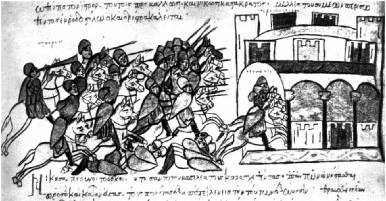
A magyar sereg üldözi Simeon bolgár fejedelmet a honfoglalás el?estéjén (895) 13. századi bizánci miniatúra

A bizánci flotta segítette a dunai átkelésben a magyar hadakat, akik Simeont két csatában is legy?zték. Simeon ezt követ?en kibékült Bizánccal, akik így magukra hagyták a magyar sereget. Így a harmadik csatában már bennünket gy?zött le a bolgár cár.