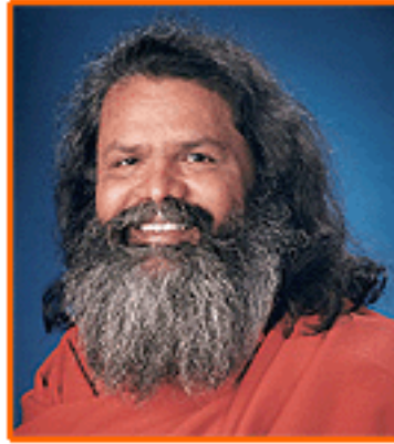
Kép: Paramhans Swami Maheshwarananda Ji, a Mesterem

Talán azon a napon, amikor szinte kezd? vegetáriusként kitaláltam, hogy jógát szeretnék gyakorolni és a városban, ahol élek, ráakadtam egy jógatanfolyamra. „Véletlenül” egy Jóga a mindennapi életben tanfolyamra. Találkoztam azzal az emberrel, Sri Swami Maheshwaranandajivel, akit Mesteremként tisztelhetek és igyekszem életemet az ? tanítása szerint alakítani.