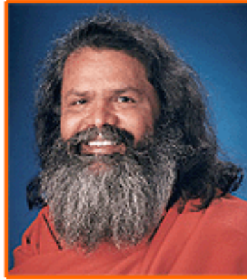
Kép: Paramhans Swami MaheshwaranandaJI, a Mesterem

Talán azon a napon, amikor szinte kezd? vegetáriusként kitaláltam, hogy jógát szeretnék gyakorolni és a városban, ahol élek, ráakadtam egy jógatanfolyamra. „Véletlenül” egy Jóga a mindennapi életben tanfolyamra. Találkoztam azzal az emberrel, Sri Swami Maheshwaranandajivel, akit Mesteremként tisztelhetek és igyekszem életemet az ? tanítása szerint alakítani.