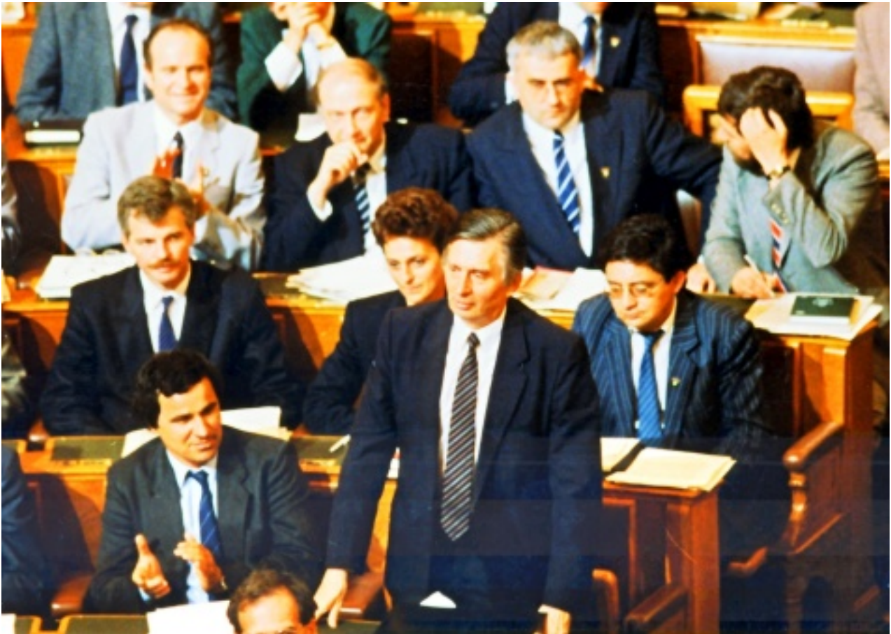
Antall József els? felszólalása 1990 májusában a szabadon választott országgy?lésben

Egy ilyen priorálást kér? szolgálati jegyb?l tudjuk, hogy a BM X. osztálya, az operatív nyilvántartó 1954 június 15-i "Szigorúan titkos - H" válasza szerint Aczél György a BM Büntetés végrehajtás Operatív Osztályának hálózati ügynöke - tehát fogdaügynöke - volt. (ÁBTL. 3.1.9. V-142696) ( 10. sz. melléklet )