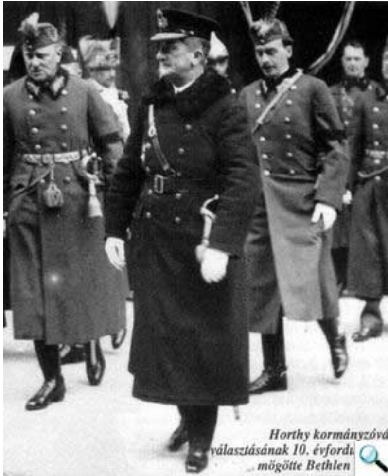
Horthy kormányzóvá választásának 10. évfordu- mögötte Bethlen