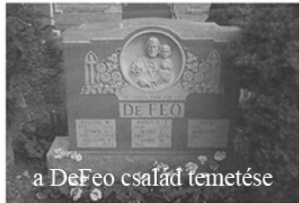
a DeFeo család temetése

Természetesen a földöntúli erőkben hívők azonnal magyarázatot találtak a különös eseményekre. A ház többszörösen indián temetőre épült, így azonnal meg volt a válasz. A megbolygatott indiánok szellemei kísértének és gonosz tettekre csábították az amúgy is labilis lelkű fiút.