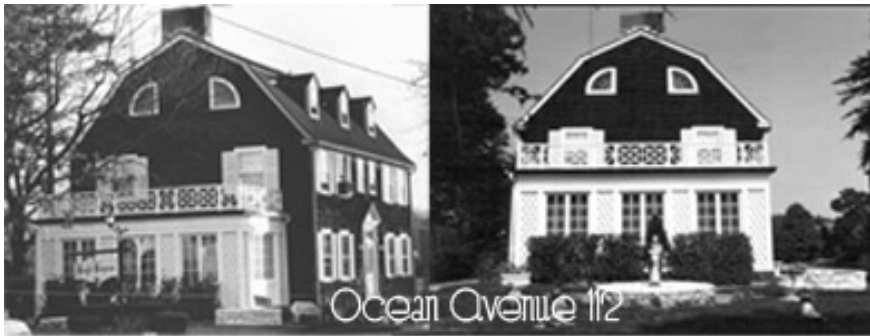
Ocean Avenue 112