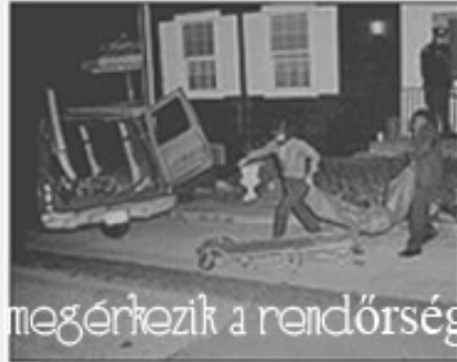
megérkezik a rendőrség