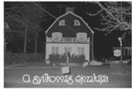
A gyilkosság éjszakáján