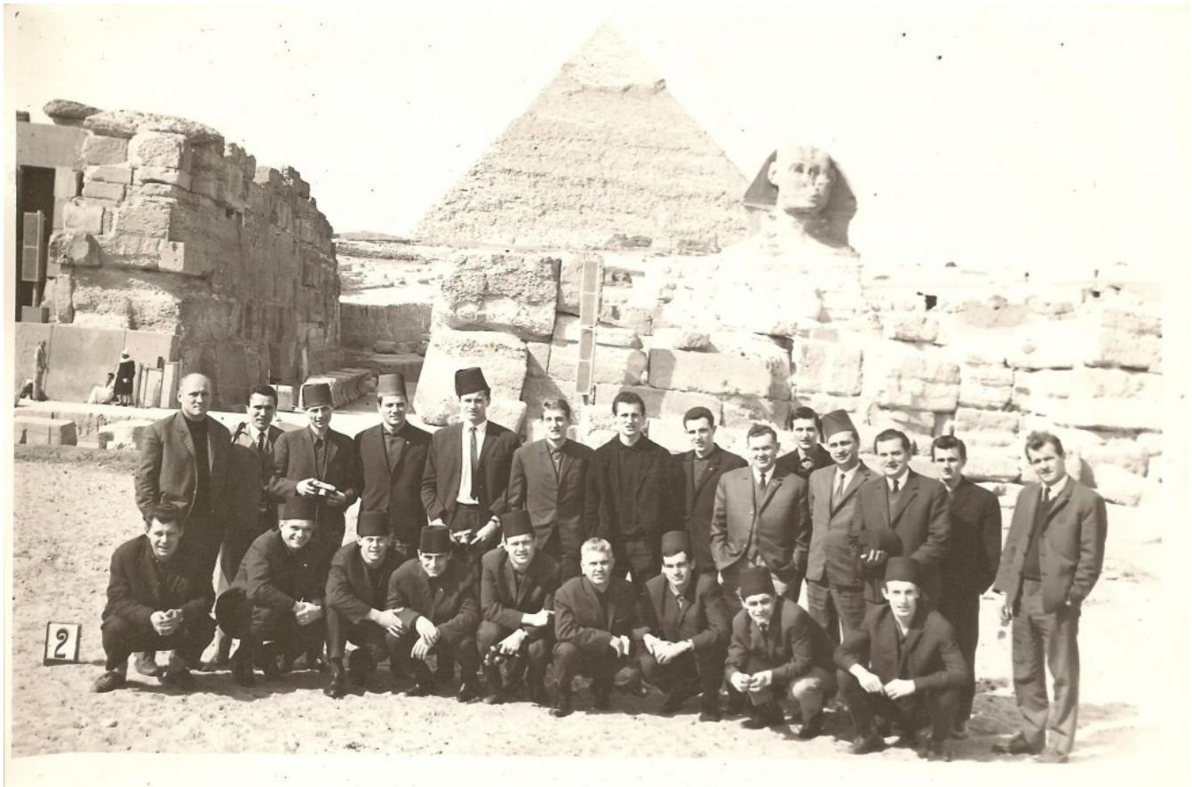
Egyiptomban a Lakat-csapat 1967 februárjában.

Betűkkel is leírom, részint, mert olyan parádés, részint mert szinte hihetetlen: 15 meccsből a csapat 14-et nyer meg, egyetlen játszik döntetlenre, veretlen marad, s 40 rúgott góljára 9 kapott esik. (Arról már nem is beszélve, hogy előnye már ekkor 7 pont a második helyen utána loholó Újpesttel szemben, amely az őszi folytatásban, annak a közepe táján, lesz még 11 pont is!)