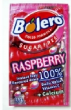
...ezen pedig már méterek?l kiszagolom a kemikáliát

Az aszpartamista lobby világszerte nagyon er?s, csak bizonyos vadmaterialista héberek hiányával megáldott területeken nem bírta eleddig érvényesíteni befolyását. Magyarországon lépten-nyomon beleütközünk a korcsosítók által promotált gusztustalanságokba, f?ként a külföldr?l behozott, globális szempontból tündökl? márkák tették magukévá ezt az összetev?t (kóka és popsi kólák termékei), de a gyanúsán olcsó üdít?k is veszélyeztetettek. Eközben a rákos és idegrendszeri megbetegedések burjánzanak, aranykorukat élik Hazánkban, az ?snépességet 6 millióra leszállítani kívánó körök pedig enyves kezeiket dörzsölgetik. Aszpartámtól, nátrium-glutamáttól, fenil-alanint?l tizedel?dik a magyar gój, miközben az antimagyar zabáltatók méregdrága biokajáktól böffentenek visszhangot el?idézve.