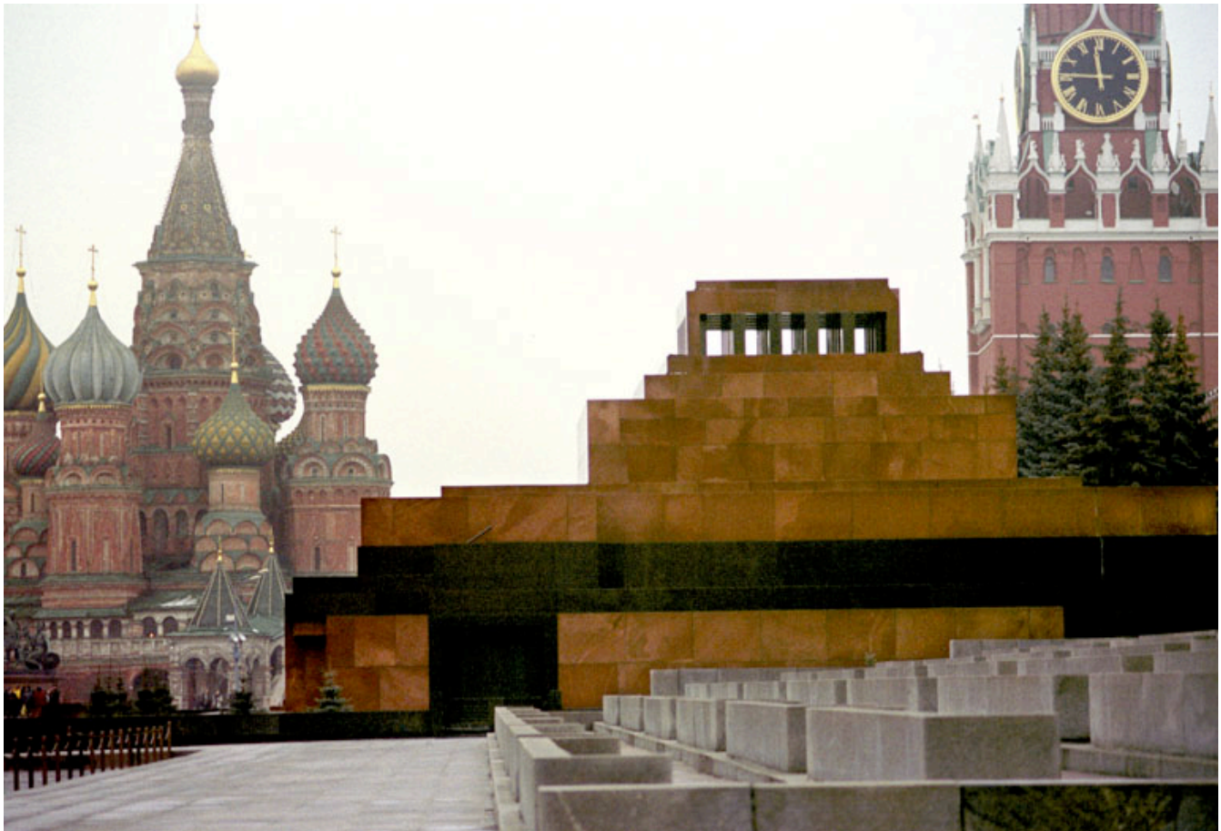
Birodalmi álmok - a Kreml épülete

Putyinnak jelenleg nincs komoly kihívója. Személyes sorsa, vagyis hogy képes-e megőrizni hatalmát, összefonódni látszik Oroszország sorsával.