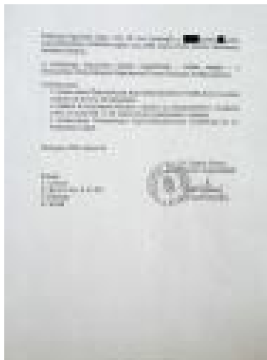
Bérbeadói nyilatkozat 2. oldal