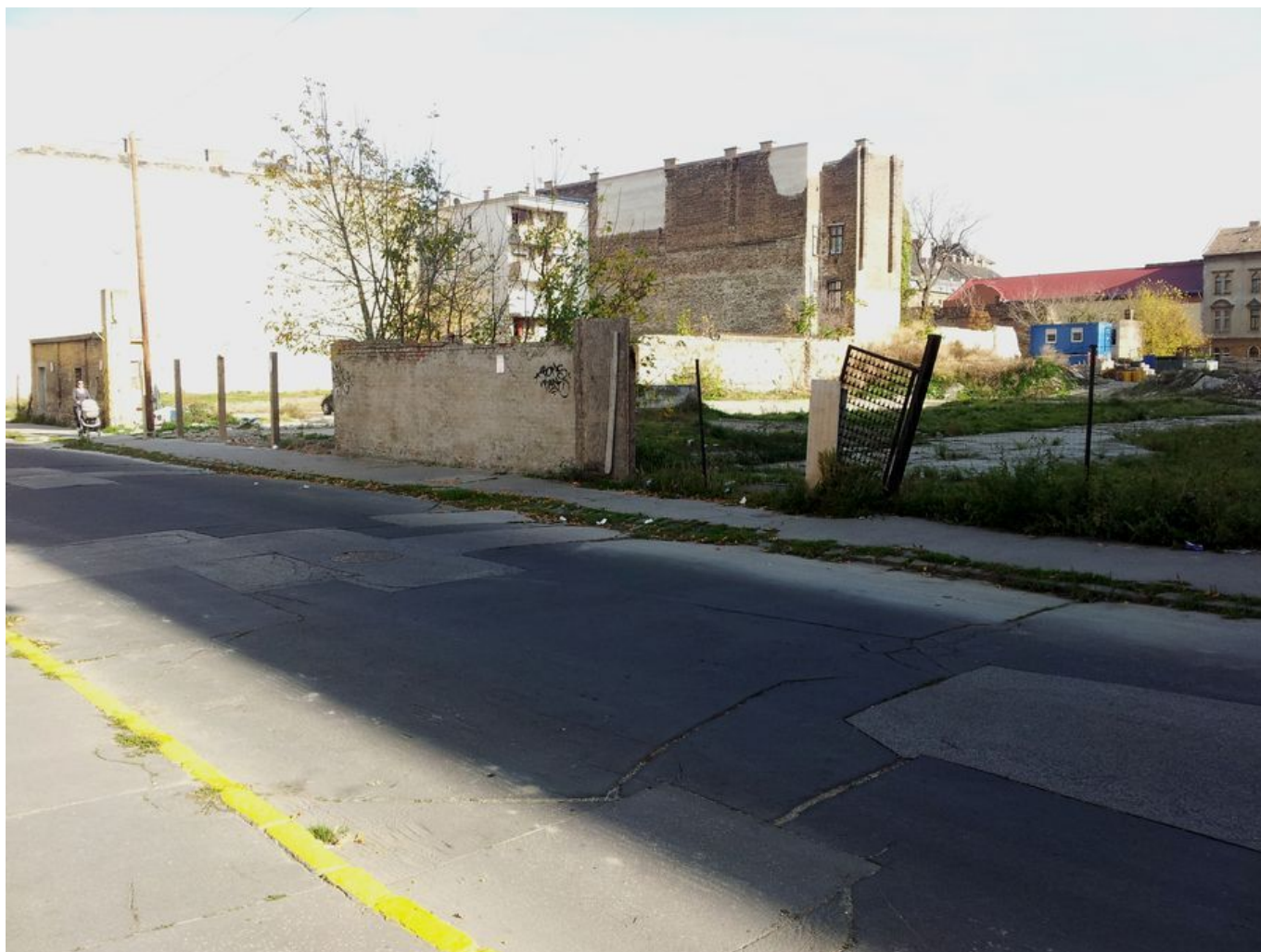
Ennyi maradt a Csepelre költöztetett romák otthonából: ez három egykori szociális bérház helye