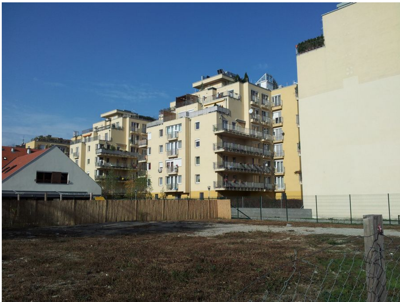
A "véd?sáv" egyik oldalán láthatók az új építés? házak: ezekben nem a régi lakók élnek