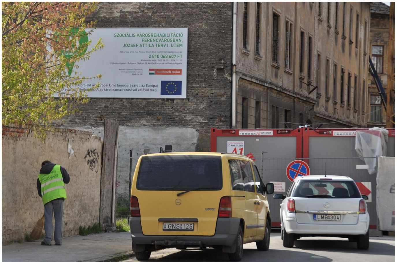
A "véd?sáv" másik oldalán maradtak a régi szociális bérházak: ezeket most már felújítják