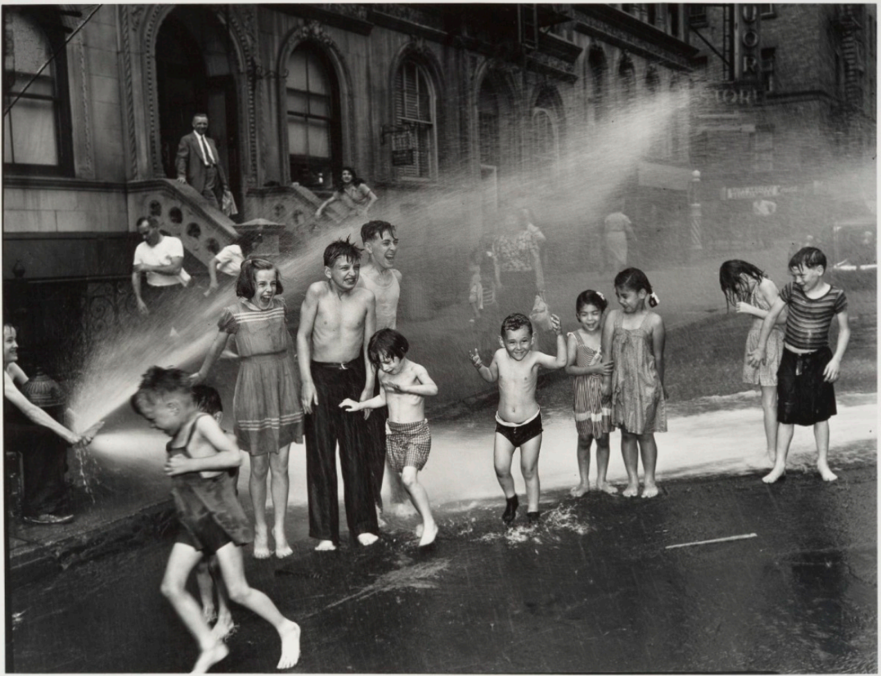
Fotó: Weegee: Summer on the Lower East Side, 1937

bejegyzésünkbe a fotóművészet híres tűzcsapjai közül válogattunk. Kellemes hűsölést!