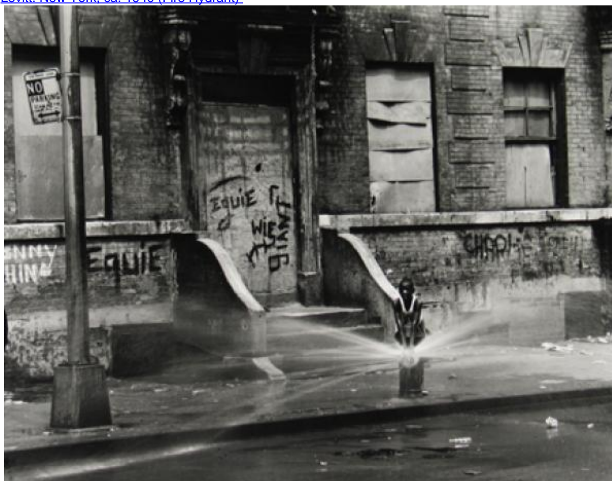
Fotó: Bruce Davidson: Untitled, East 100th Street (Boy and Fire Hydrant), 1966-68