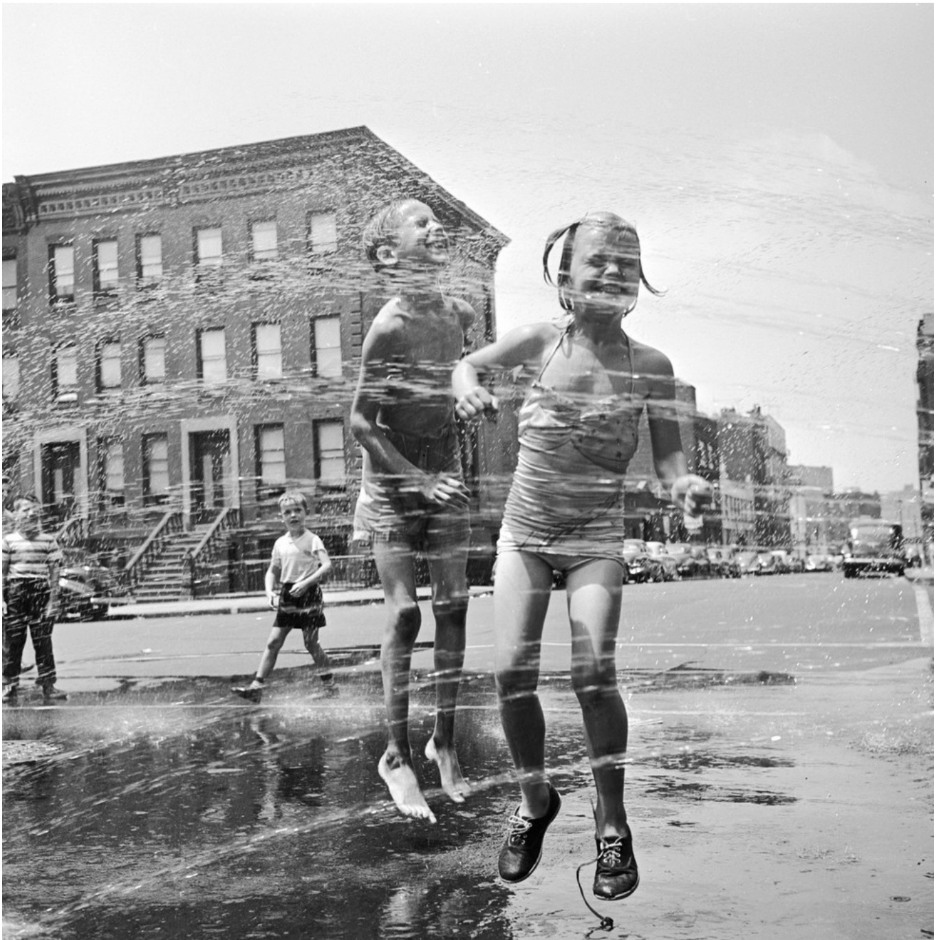
Fotó: Two children jumping through a water hydrant's shower on a New York street. 1950