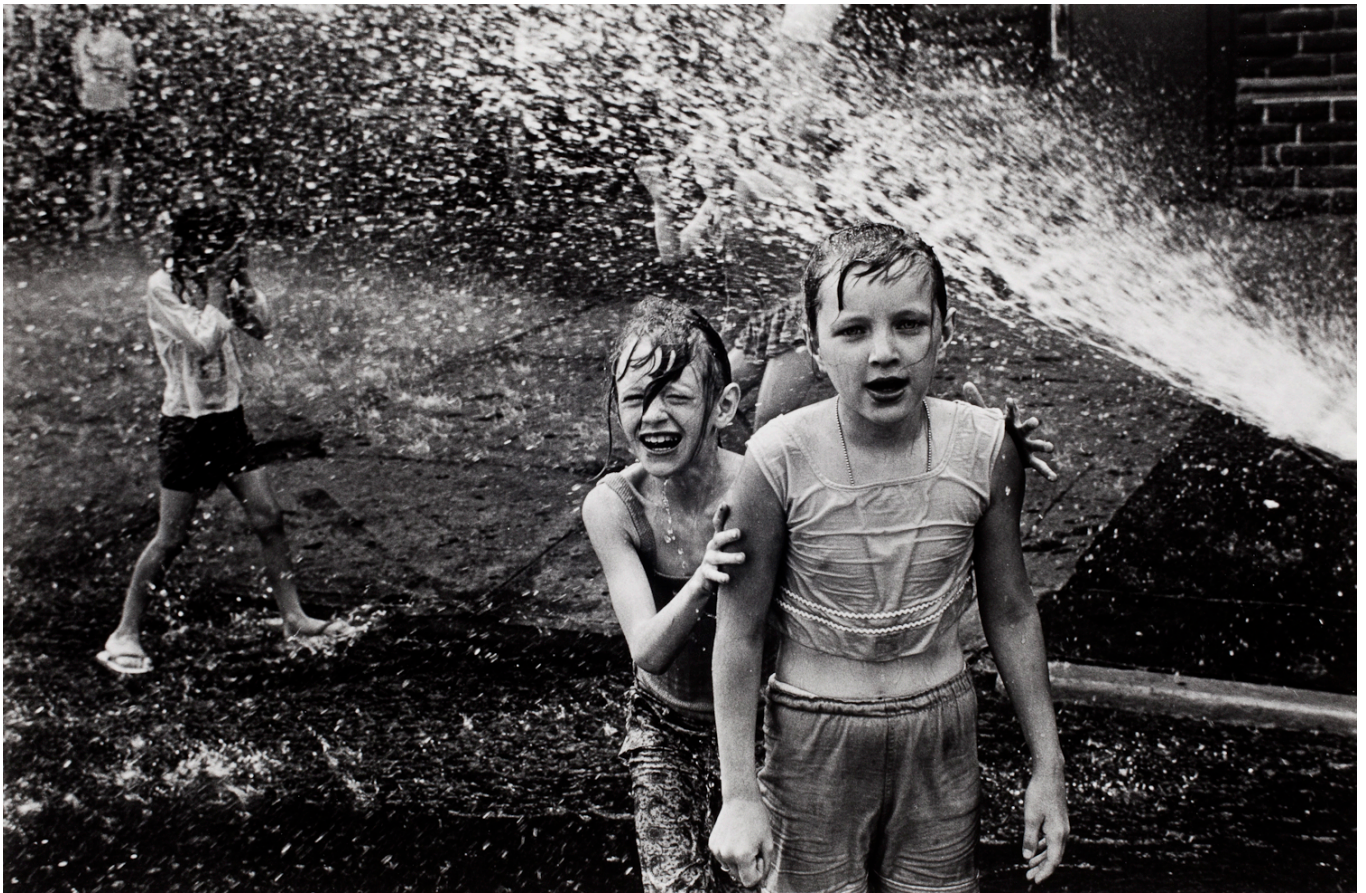
Fotó: Charles Pratt: Hoboken, 1963